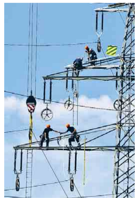
Dagmar Theßen aus Weilerswist beobachtete die Demontage dieses Strommastes bei Neuhem.