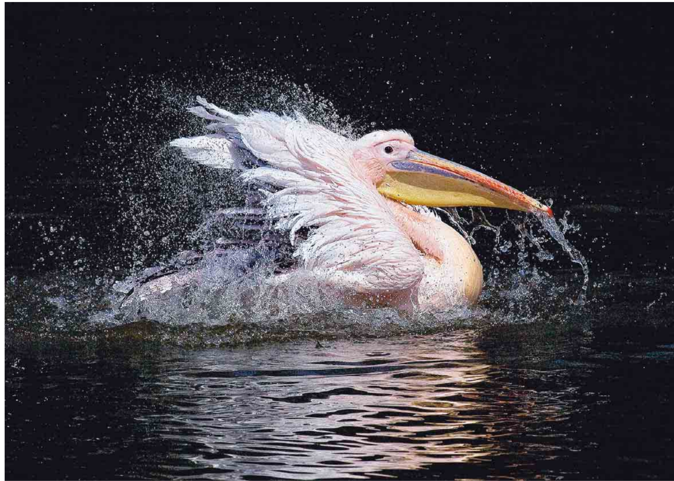
1. Platz So eindeutig wie im dritten Teil fiel das Ergebnis der Jury noch nie aus: Drei von vier Juroren wählten dieses Foto auf Platz eins, der vierte im Bunde auf Platz zwei. Fotografin Vera Peiter aus Kleinbüllesheim nannte ihr Bild „Wasserspaß“. Aufgenommen wurde es in Mannheim. Die Fotografin schreibt: „Dieser Rosapelikan planschte eine ganze Zeit lang im Wasser herum, es muss wohl ein Riesenspaß gewesen sein.“