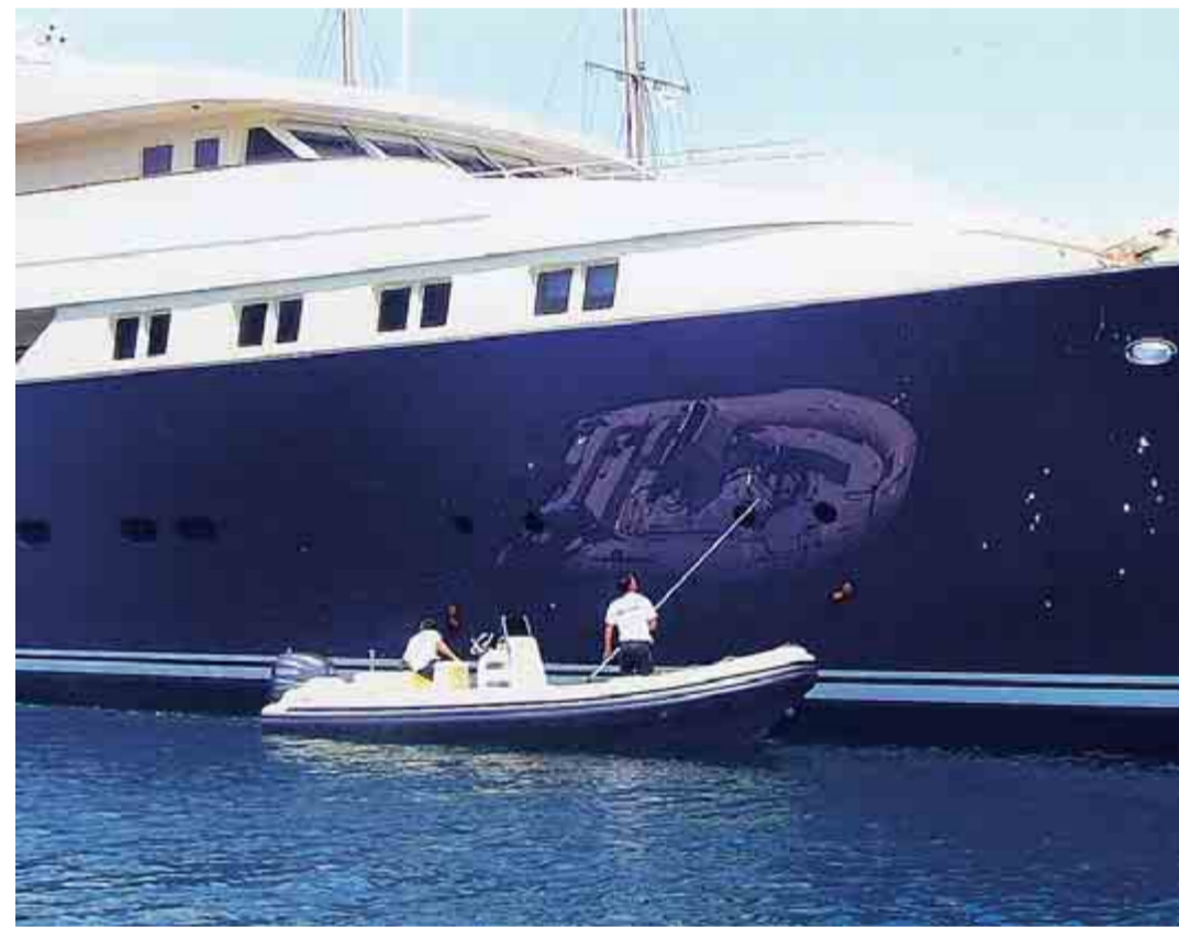
3. Platz „Spieglein, Spieglein an der Wand, wer macht die überflüssigste Arbeit im ganzen Land?“, fragte sich Claudia Jander aus Euskirchen, die dieses Foto „schoss“.