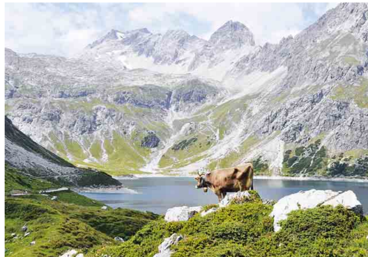
5. Platz „Auch die Kuh Elsa hat mal Urlaub“, findet Hans Krauß aus Großbüllesheim und beschreibt gleichzeitig damit sein Foto.

So ganz war sich die Lokalredaktion diesmal bei der Sichtung der Bilder nicht sicher: Haben viele Leser einfach nur versucht, unser Beispielbild von vor zwei Wochen nachzustellen? Auf jeden Fall kamen einige Fotos an, mit Menschen, die ins Wasser springen oder daraus hervorschnellen. Mit „Urlaub, Sommer, Action“ war der dritte und letzte Teil der Sommer-Aktion überschrieben. Insgesamt 71 Hobby-Fotografen schickten 176 Fotos an die Lokalredaktion, einige der Teilnehmer waren „Wiederholungstäter“. Zwei E-Mails konnten leider nicht gewertet werden, sie kamen drei Tage nach Einsendeschluss an. Am Ende siegte ein Wasserbild der anderen Art: Vera Peiter aus Kleinbüllesheim schickte ein Foto eines Rosapelikans, der im Wasser planscht. Sowohl optisch als auch technisch hat es die Jury, die aus dem stellvertretenden Redaktionsleiter Günter Zumbé, den Redakteuren Johannes Bühl und Reiner Züll sowie Mitarbeiter Thomas Schmitz bestand, überzeugt. Für drei von vier Juroren war es das beste Bild, für den vierten im Bunde das zweitbeste. Vera Peiter, deren weitere Einsendungen eben-