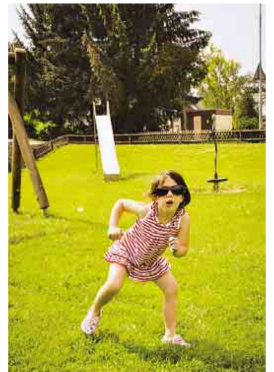
Mira Wolter aus Kall sorgte mit diesem Foto eines tanzenden Kindes für Schmunzeln bei der Jury.