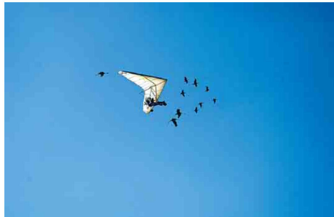
2. Platz Den zweiten Platz sicherte sich Gerd Noé aus Schmidheim. Der Fotograf nannte das Bild „Begleitschutz“, aufgenommen wurde es an der Dahlemer Binz.